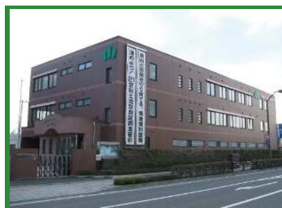
大崎市古川旭にある古川事業所