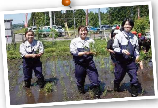
農業実践研修で田植えに挑戦