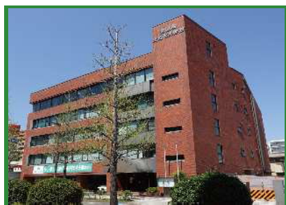
仙台市青葉区上杉の本部事務所